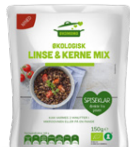
Vare nr. 17524 Økomama Linse & kernemix 6x150 g pr. kolti