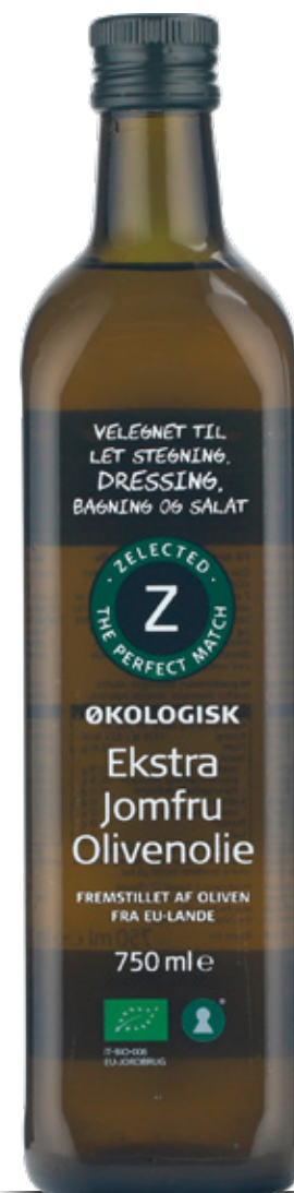
Vare nr. 17792 Z Øko EVO Indhold pr. kolli 6x750 ml.