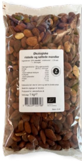
Vare nr. 12279 Z ØKO Mandler, ristede & saltede 6x1000 g pr. kolli