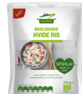
Vare nr. 17527 Økomama Hvide ris 6x250 g pr. kolti