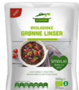
Vare nr. 17520 Økomama Grønne linsér 6x150 g pr. kolti