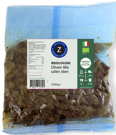
Vare nr. 12274 Z Øko Oliven mix 6x1500 g pr. kolli