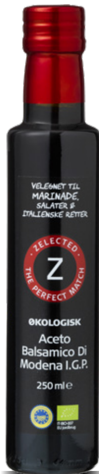
Vare nr. 10413 Z Øko Balsamico Indhold pr. kolli 8x250 ml.