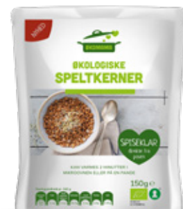
Vare nr. 17518 Økomama Speltkerner 6x150 g pr. kolti