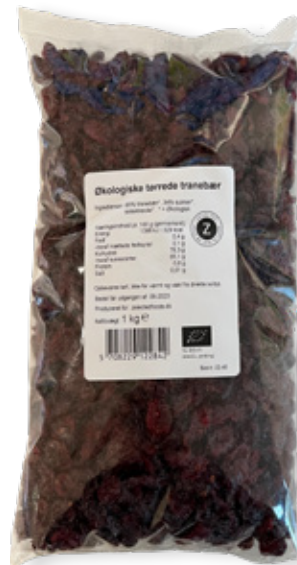
Vare nr. 12284 Z ØKO Tranebær 6x1000 g pr. kolli