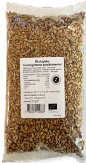
Vare nr. 12286 Z ØKO Solsikkekerner, honningristede 6x1000 g pr. kolli