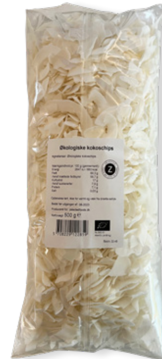
Vare nr. 12285 Z ØKO Kokoschips 6x500 g pr. kolli