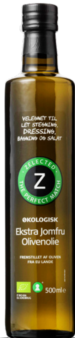
Vare nr. 10469 Z Øko EVO Indhold pr. kolli 6x500 ml.