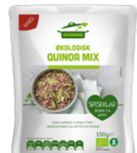
Vare nr. 17525 Økomama Quinoa-mix 6x150 g pr. kolti