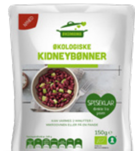
Vare nr. 17522 Økomama Kidneybønner 6x150 g pr. kolti