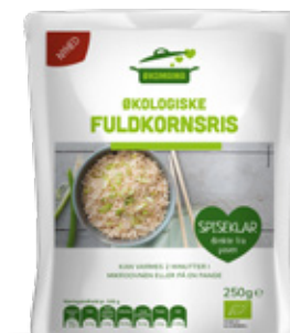
Vare nr. 17528 Økomama Fuldkornsrís 6x250 g pr. kolti