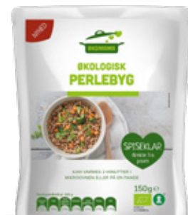
Vare nr. 17519 Økomama Perlebyg 6x150 g pr. kolti