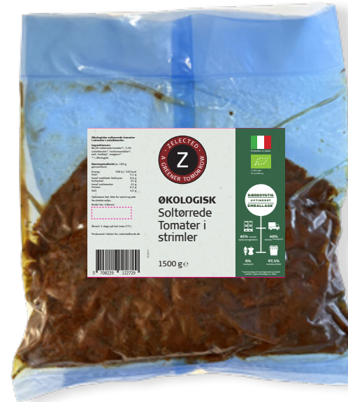
Vare nr. 12272 Z Øko Soltørrede tomater i strimler 6x1500 g pr. kolli