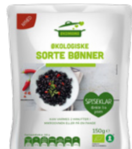
Vare nr. 17517 Økomama Sorte bønner 6x150 g pr. kolti