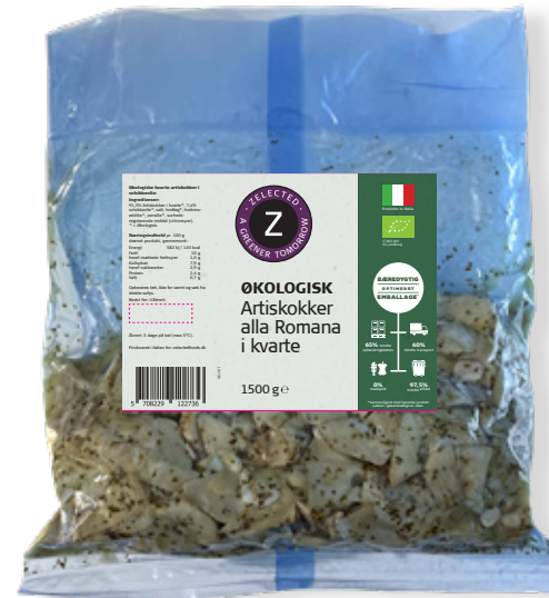
Vare nr. 12273 Z Øko Artiskokker i kvarte 6x1500 g pr. kolli