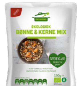
Vare nr. 17523 Økomama Bønne & kernemix 6x150 g pr. kolti