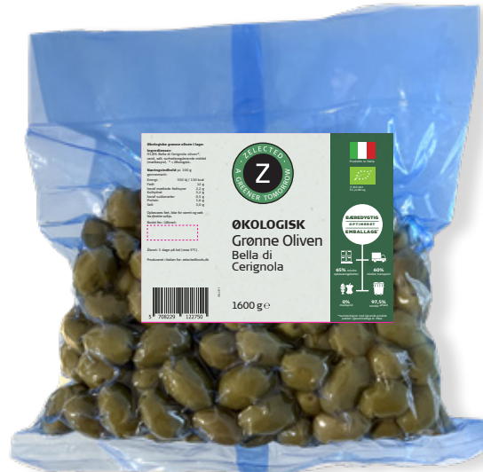
Vare nr. 12275 Z Øko Grønne oliven Bella di Cerignola 6x1600 g pr. kolli