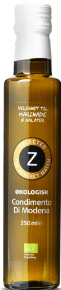
Vare nr. 10414 Z Øko Condimento Indhold pr. kolli 8x250 ml.