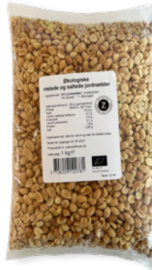
Vare nr. 12278 Z ØKO Peanuts, ristede & saltede 6x1000 g pr. kolli